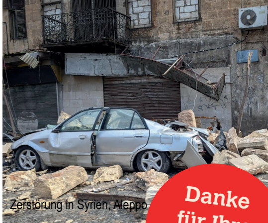
Zerstörung in Syrien, Aleppo