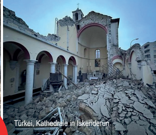
Türkei, Kathedrale in Iskenderun