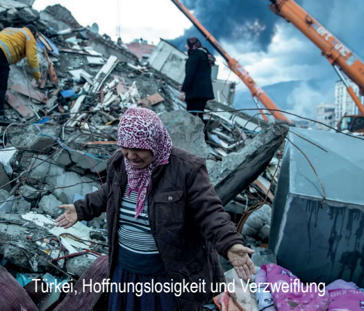
Türkei, Hoffnungslosigkeit und Verzweiflung