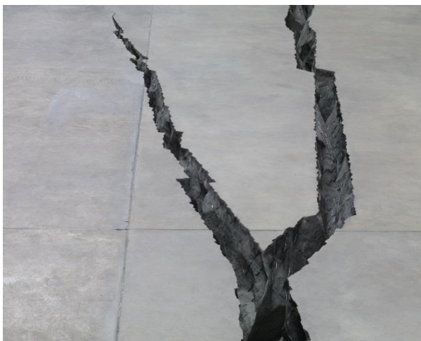
© Doris Salcedo, The Unilever Series: ris Salcedo, Shibboleth, October 2007–April 2008, Turbine Hall, Tate Modern, London 2017

Staates an diesen Menschen – als willkommene Arbeitskräfte – ab und andererseits von nationalen und internationalen Bestimmungen. Der Unterschied zwischen staatsbürgerlichen und Menschenrechten markiert die Grenze zwischen dem Politischen und Humanitären. Wer über keine politischen Zugehörigkeitsrechte als Staatsbürgerin oder Staatsbürger verfügt, weiss als «nackter» Mensch nur die humanitären Menschenrechte hinter sich.