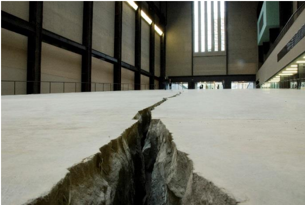
© Doris Salcedo, The Unilever Series: ris Salcedo, Shibboleth, October 2007–April 2008, Turbine Hall, Tate Modern, London 2017

maschinerie, die im Laufe der Menschheitsgeschichte auf immer barbarischere Weise perfektioniert wurde.